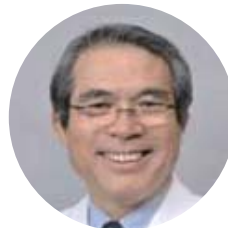
ふくだ まもる 福田 護 先生

14:10～ 講演 1 がん哲学外来 新百合ヶ丘メディカル・カフェ顧問 福田護先生による講演