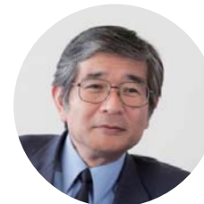
ひの おきお 樋野 興夫 先生

14:40～ 講演 2 順天堂大学病理・腫瘍学教授 一般社団法人がん哲学外来理事長 樋野興夫先生による講演