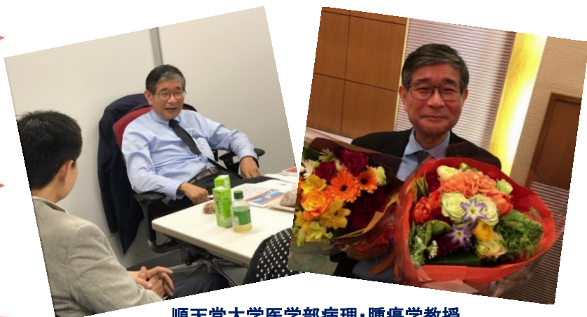
順天堂大学医学部病理・腫瘍学教授 樋野興夫先生